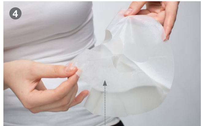
Remove the upper backing Obere Folie abziehen