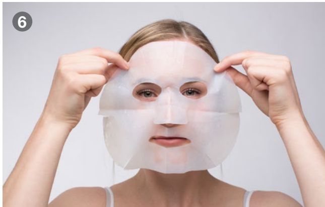
6 Apply the mask on your face Maske auflegen