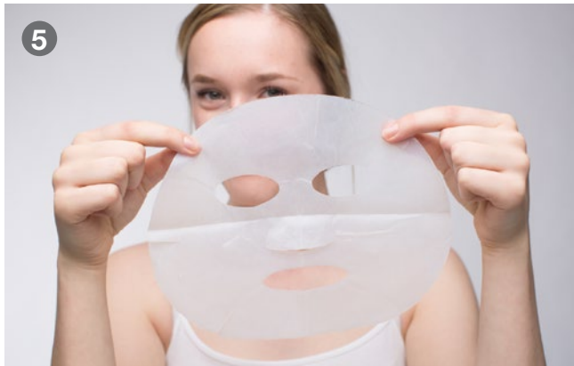
5 Place mask in front of your face Maske vor das Gesicht halten