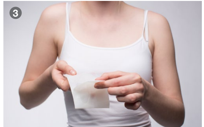
Unfold the mask Maske auffalten