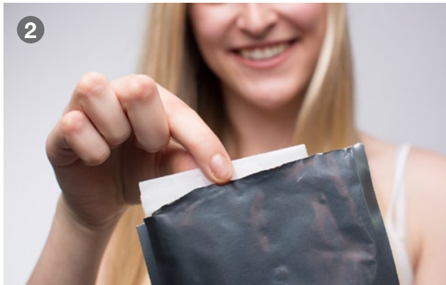
Take out the mask Maske herausnehmen