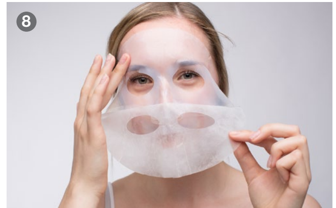
8 Remove the upper backing Obere Folie abziehen