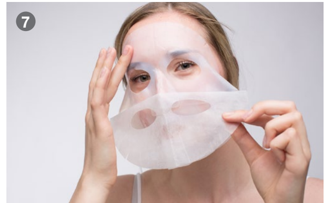
7 Stroke the surface until smooth Mit dem Finger glatt streichen